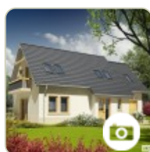
A może domek z poddaszem?